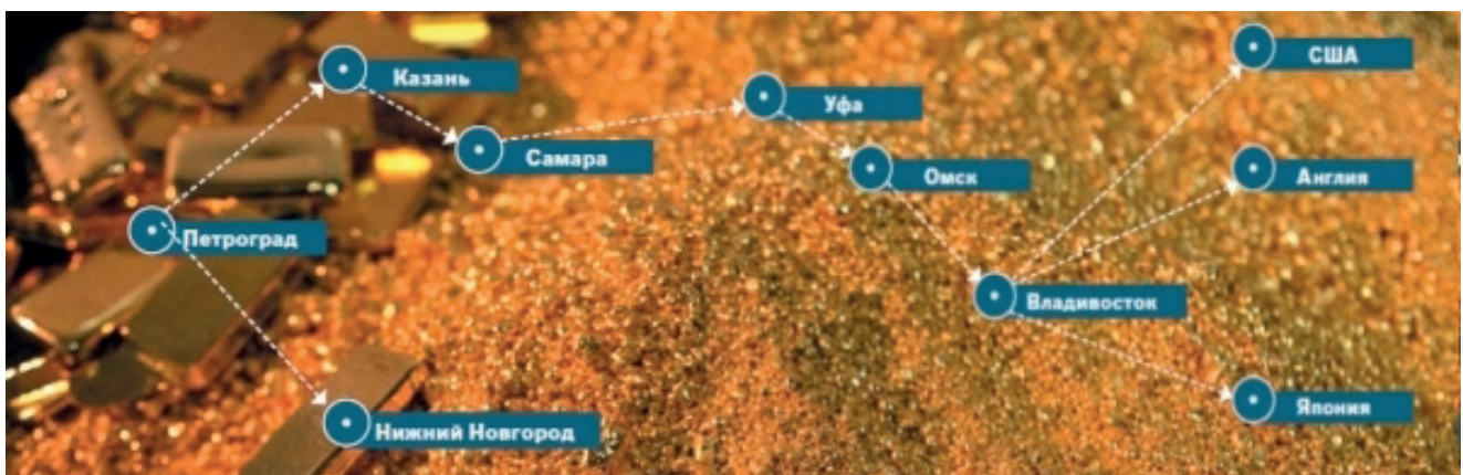
Маршруты. Фото: РИА Новости gia.ru/ инфографика

Примерная стоимость строительства двух атомных электростанций.