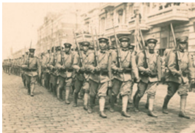
Август 1918 г. Владивосток. Японские войска на улице Светланской

– Реального «золота Колчака» нет. Слитки и российские монеты давно переплавлены. Зато