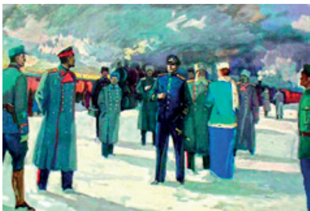
К. П. Белов. Предварительный арест Колчака. 1965 г.

Вечером 15 января поезд прибыл в Иркутск, где Колчак, Пепеляев, А.В. Тимирева (жена А.В. Колчака) и еще 113 человек, оставшихся в эшелоне, были заключены в Иркут-