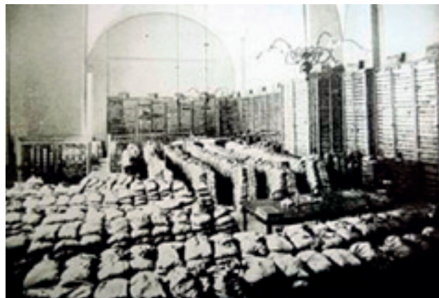
1918 г. Золотой запас России в казанском Госбанке. Здесь его захватит белогвардейский отряд В. Каппеля

Вот только оружие Колчаку японцы так и не поставили. И золото не вернули.