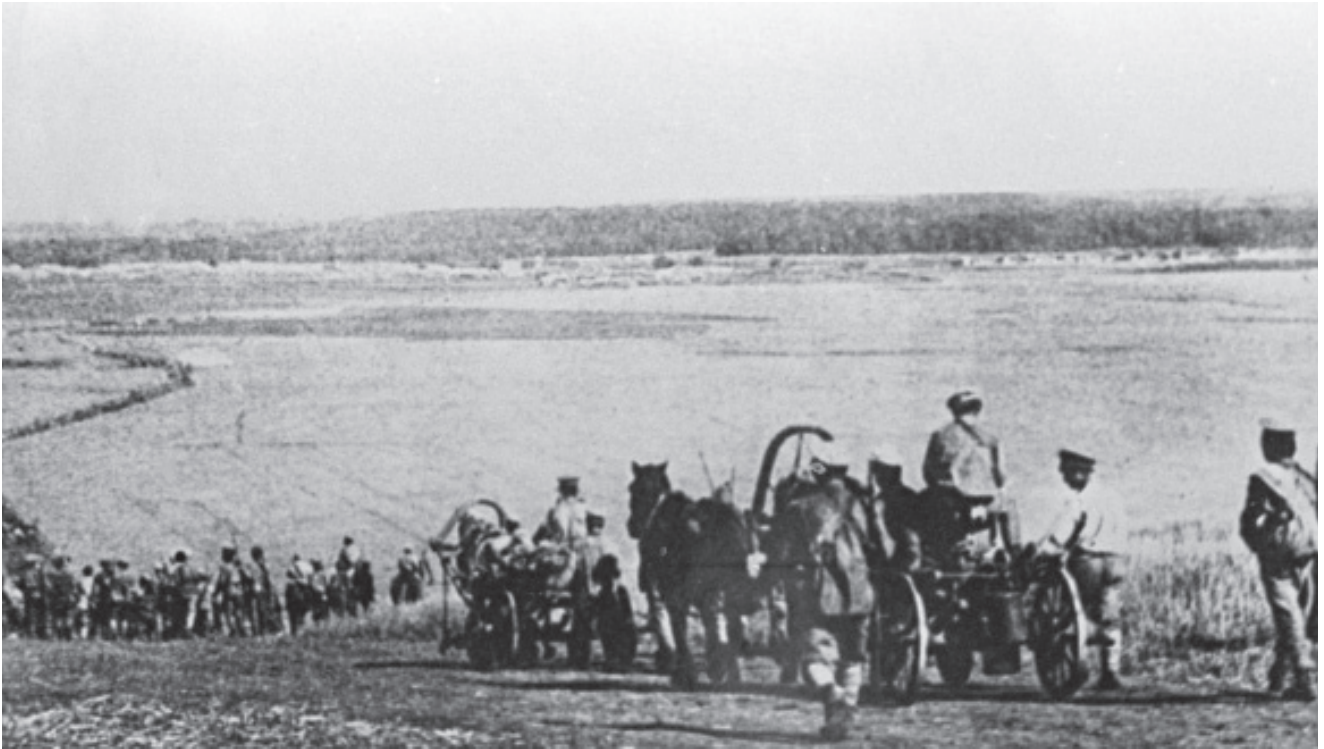
Август 1919 г. Отступление армии Колчака на восток.